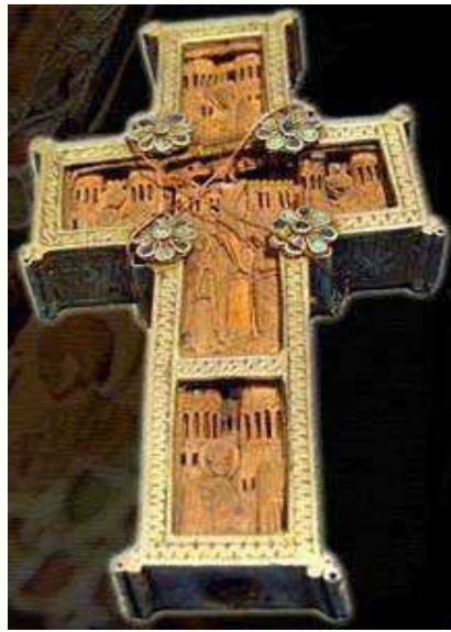
Cruce de binecuvântare, ferecată în argint filigranat (1743, Sfânta Mănăstire Putna)