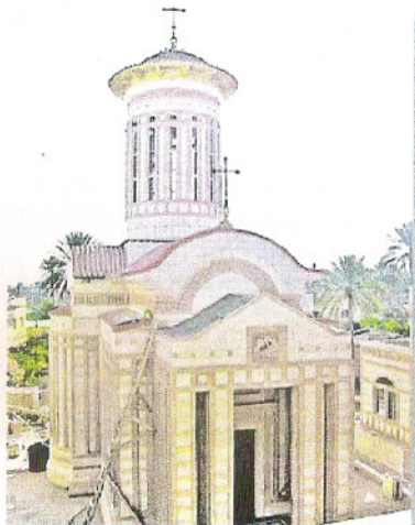
Așezământul Românesc de la Ierihon